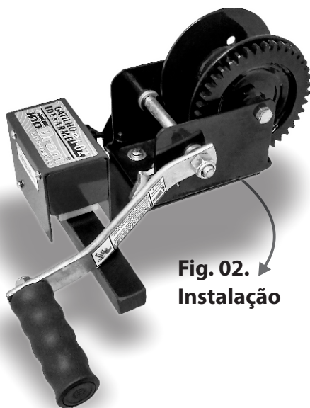
Fig. 02. Instalação